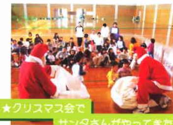
★クリスマス会でサンタさんがやってきた