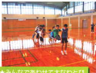
★みんなであわせて大なわとび

のびのびスポーツ教室では、空手やなぎなた、サッカーなどの各種スポーツ教室に加えて、いつでもだれでも参加できる「ジュニアスポーツ教室」を毎週土曜日(午前中)に開催しています。 平成20年度は新たな取り組みとして「出張ジュニア教室」を行いました。市街地から離れた4つの小学校でグラウンドゴルフやベタングなどのスポーツを行い、子どもたちは仲間と一緒に楽しい時間を過ごしました。