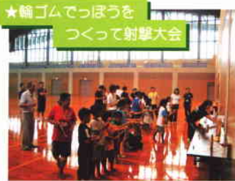
★輪ゴムでつぼうをつくって射撃大会