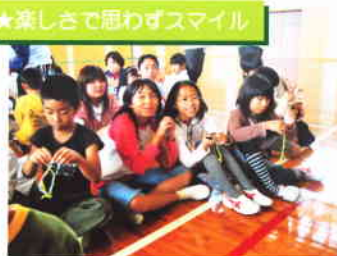
★楽しさで思わずスマイル