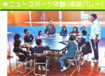
★ニュースポーツ体験(卓球/バレー)