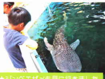
★ジンベエザメも見に行きました