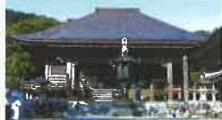
★2 第38番札所 金剛福寺