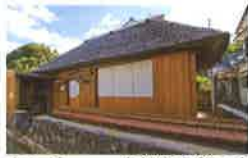
★1 ジョン万次郎生家(復元)