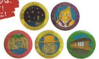
過去のピンバッジデザイン