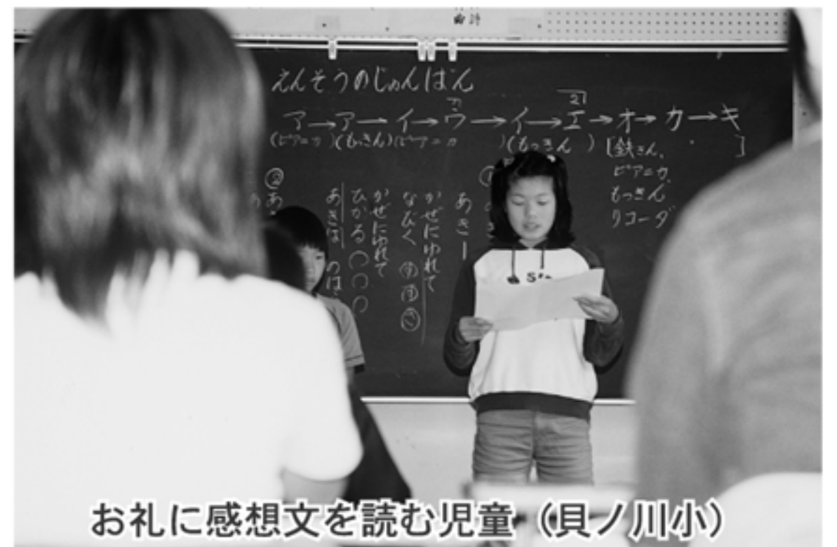
お礼に感想文を読む児童（貝ノ川小）

3日には、あいにくの雨で体育館での開催となりましたが宗呂小学校で、4日には下川口小学校、11日には下川口保育園でそれぞれ運動会が行われ、保護者はもちろん、地区のお年寄りたちもたくさん訪れ、子どもたちのかわいい踊りや元気に走り回る姿におもわず身を乗り出し、応援する姿が見られました。