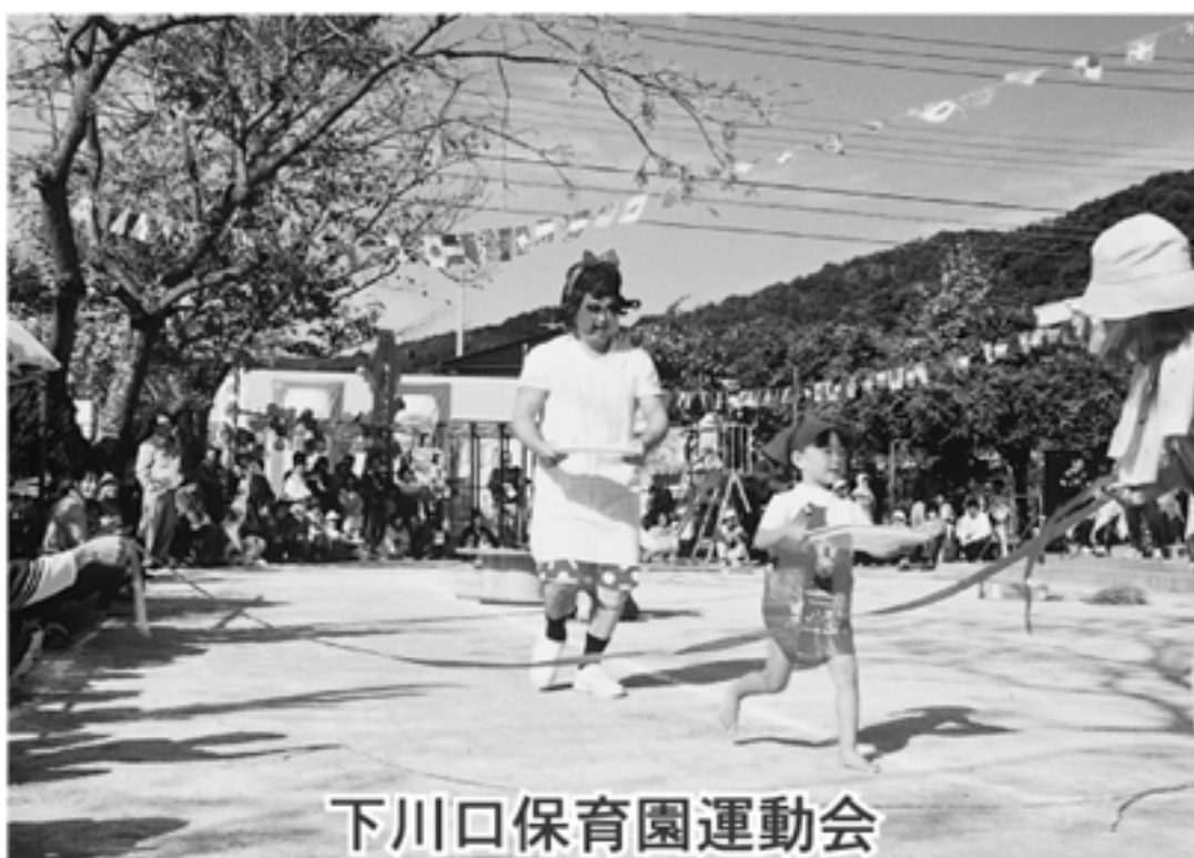
下川口保育園運動会