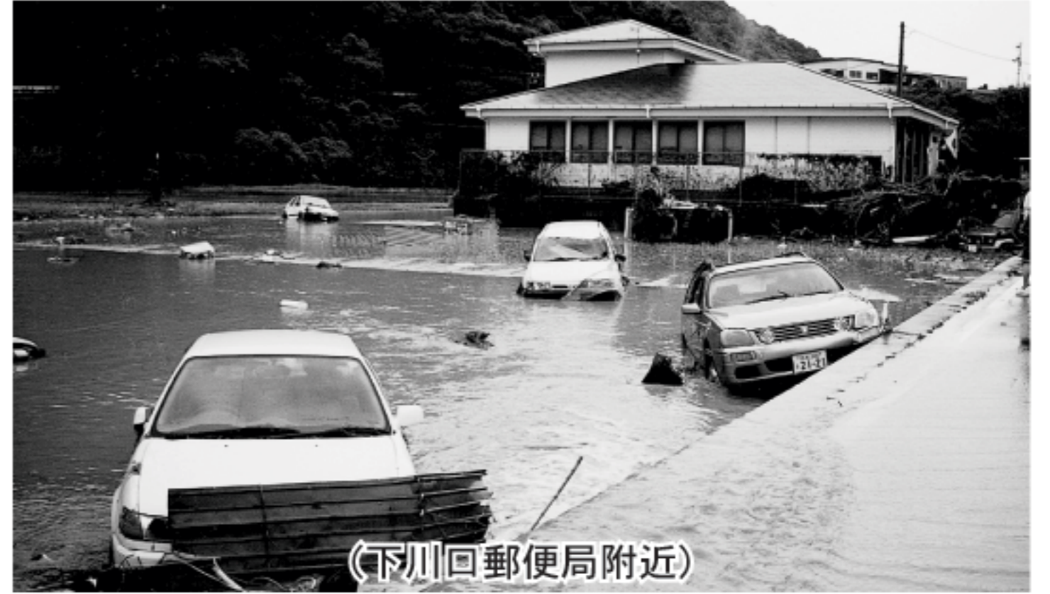
(下川口郵便局附近)