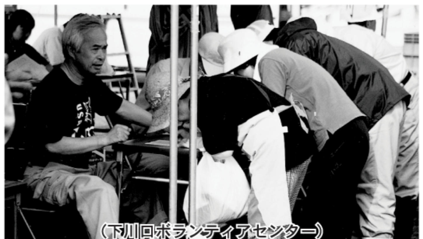
(下川回ボランティアセンター)

※公庫融資を受けて現在返済中の方で、今回の大雨による災害により被災された方については、返済方法に関する相談を受け付けております。