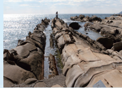
竜串海岸「大竹小竹」

高知県の天然記念物、国内最大級のシコロサンゴ。★グラスボートからご覧になれます。