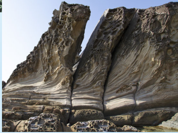
見残し海岸「屏風岩」