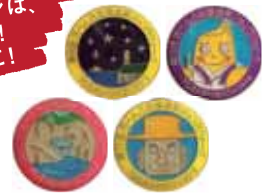
過去のピンバッジデザイン