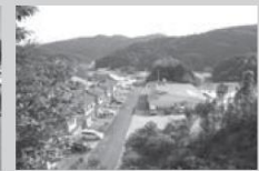
西側より撮影 右手三崎保育園 左手市営住宅