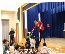
★クリスマスマジックショー