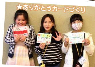
★ありがとうカードづくり