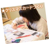
★クリスマスカードづくり