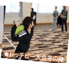
★ドッチビー大会冬の陣