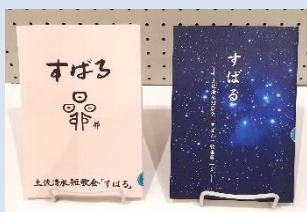
土佐清水短歌会すばる 歌集