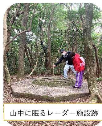
山中に眠るレーダー施設跡

◎日時： 3月18日(土) 午前9時 集合/12時30分 解散 ※雨天の場合は中央公民館で講演