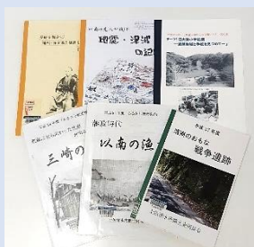
土佐清水市郷土史同好会 清水の歴史調査・研究冊子