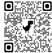
どんぐりっこホームページ QRコード

☆駐車場は、ちらら清水保育園の保護者用スペースにお願いします。車の駐車については、保護者の方の責任で十分注意してください。