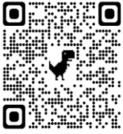
どんぐりっこホームページ QRコード

☆駐車場は、きらら清水保育園の保護者用スペースにお願いします。車の駐車については、保護者の方の責任で十分注意してください。