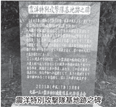
震洋特別攻撃隊基地跡之碑