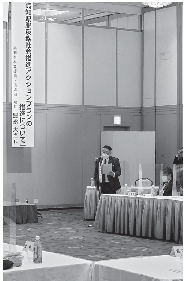
高知県市議会議長会