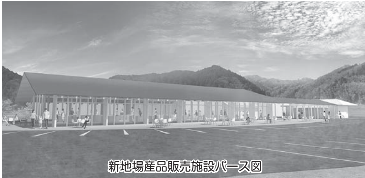
新地場産品販売施設パース図