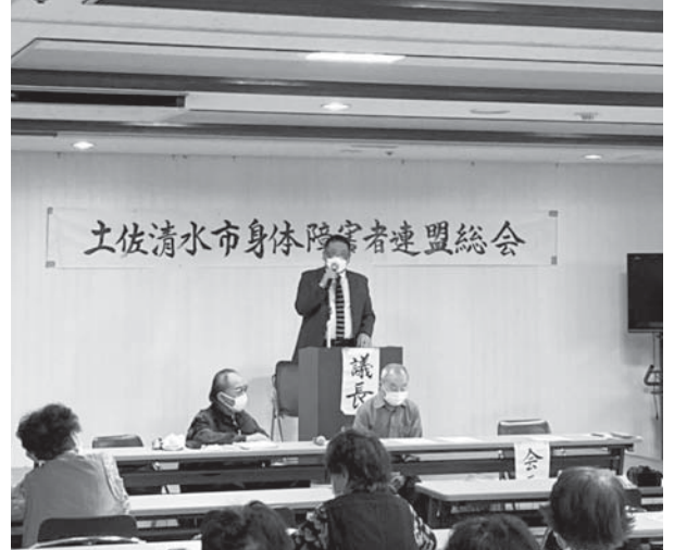
土佐清水市身体障害者連盟