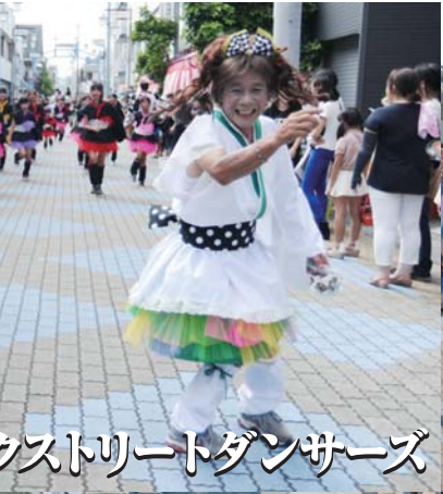
衣装特別賞 天神バックストリートダンサーズ