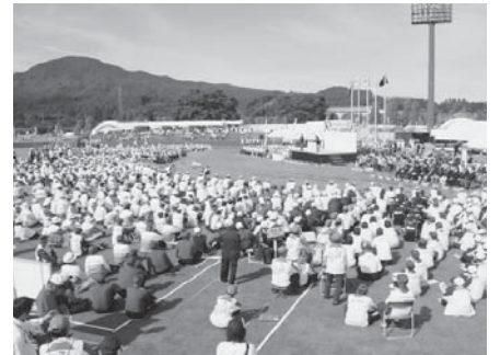
昨年開催された「宮城・仙台大会 開始式」の様子

全国大会には、土佐清水市からも「竜串チーム」が初めて出場することになり、メンバーは毎日のように練習に励んでいます。市民の皆さんも、ぜひ、全国から集う選手の皆さんの頑張っている姿をご覧いただき、賑やかで思い出に残る大会となるよう温かい応援をよろしくお願いします。