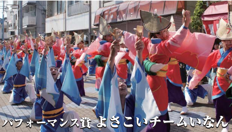
パフォーマンス賞 よさこいチームいなん