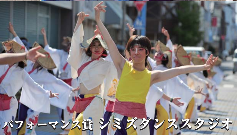
パフォーマンス賞 シミズダンススタジオ