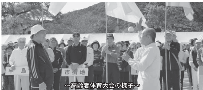
～高齢者体育大会の様子～

土佐清水市老人クラブでは、会員を募集しています。詳細については、事務局までお問い合わせください。