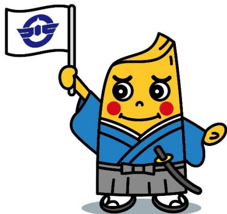
土佐清水市公認キャラクター「宗田ぶっしー君」

※申込書は健康推進課 介護保険係、下ノ加江・三崎・下川口市民センターの各窓口のほか、土佐清水市ホームページからもダウンロードできます。また、申し込みは郵送でも可能です。