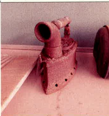
㉑ アイロン (火のし)