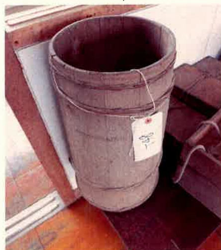
⑫ 箱メガネ (水眼鏡)