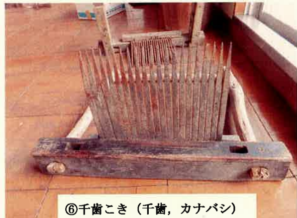
⑥千歯こき (千歯, カナバシ)