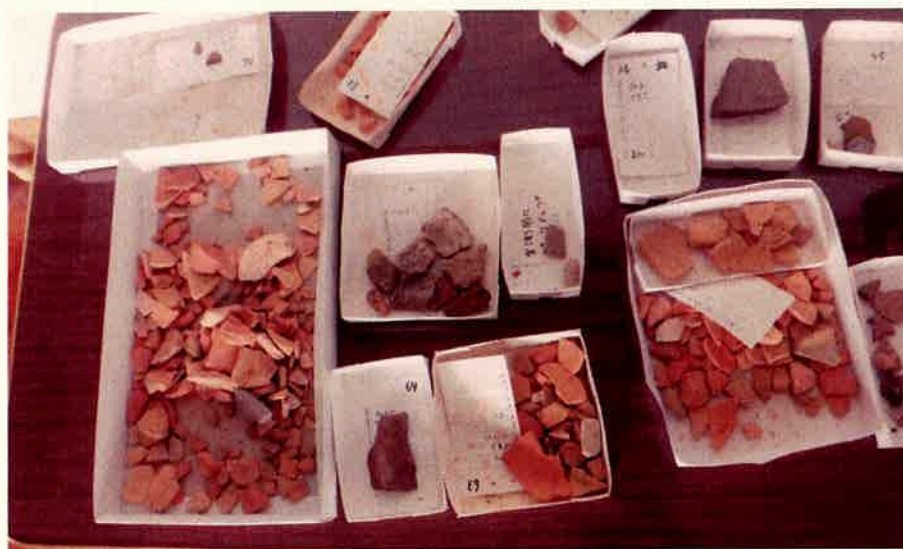
③④ 加久見氏居館跡・試掘確認調査出土の埋蔵文化財 (カワラケ片など)