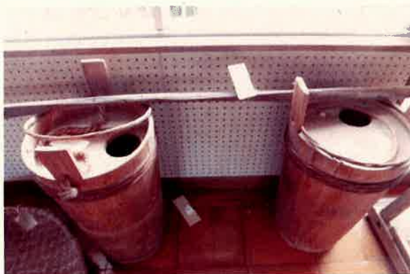
⑨ 水掛桶 (肥たご)