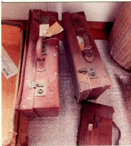
②⑦ 革製・旅行トランク