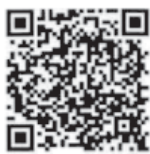
高知県防災アプリ QRコード