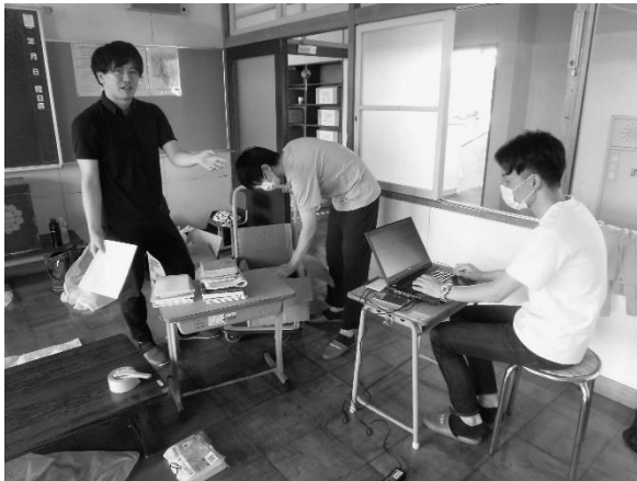
目録の打ち込み作業風景