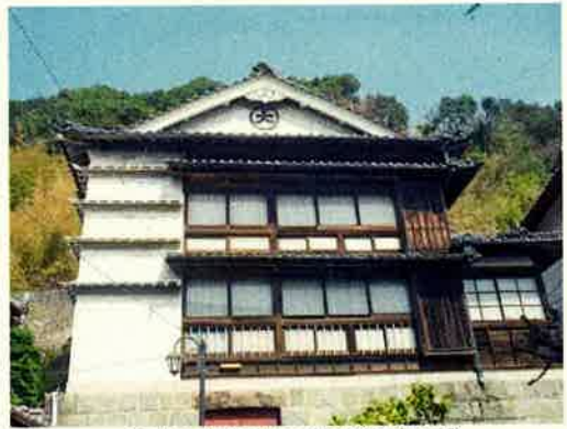
資料2 大西家住宅(奈半利町加領郷)

土佐カツ衆が操業するにあたり、餌や燃料・氷などの準備をこのイサバが代行して行う。これを「仕込み」と呼んだ。旅船は他県の船であるがゆえに現金を多額に持参していない。下田の街で物品を調達しようとしても信頼がなく、地元のイサバ屋号で物品を購入してもらった方が便利がよいからである。支払いは、港に水揚げした漁獲金から差し引かれた。イサバは仲買商としての権益も有していた。支払いできない場合は、次の水揚げまで支払いを融通したり、場合によっては分割払いということもあった。また、土佐カツ衆の中で病人が出たり、地元でトラブルにより警察沙汰で拘留されたときに、弁護士の手配も請け負った。いわば下田に滞在する期間は、身元引受人のような役割を担っていた。イサバは元々宿屋であるが、もっぱら宿屋に泊まるのは船頭などの幹部であり、船員は港に停泊中の船底に泊まった。イサバの行う職務は宿屋の機能以外、先ほど述べた「仕込み」を実施し、その物品を船に積み込むところまでを請け負った。これを「つなぎ」といった。このようにイサバは、下田住民と土佐カツ衆の間の取引や交流が円滑に進み、市場が成り立つようその緩衝的役割を担っていたのである。