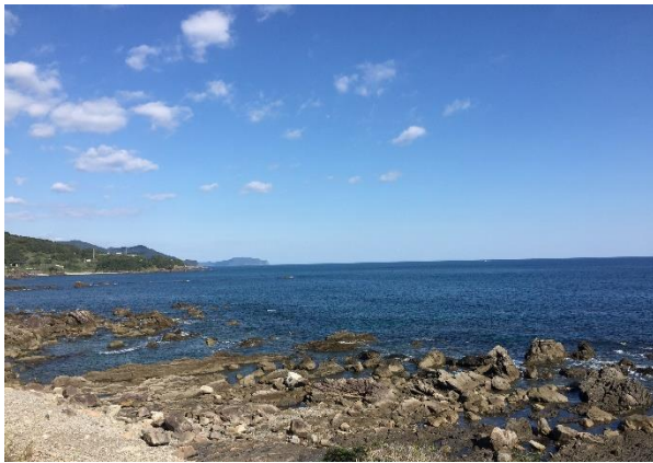
黒潮町白浜付近から見た興津崎