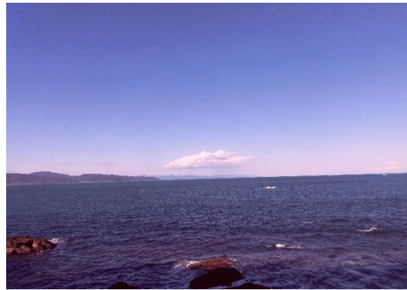
窪津付近から見た興津崎