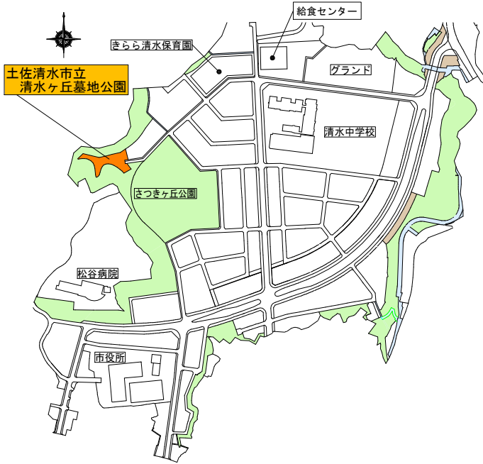
土佐清水市立清水ヶ丘墓地公園位置図