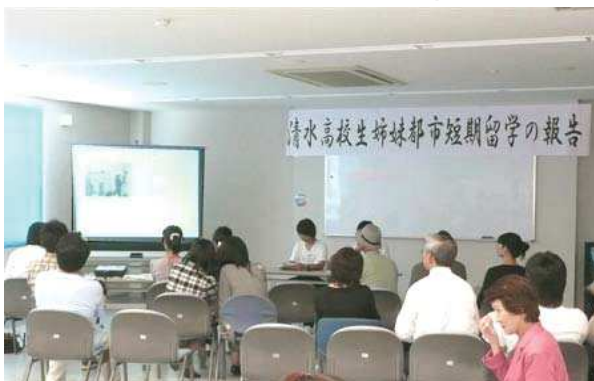
清水高校生姉妹都市短期留学発表