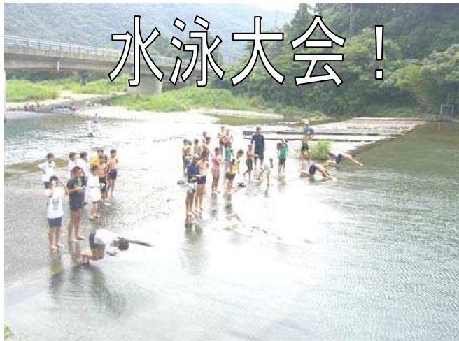
下ノ加江川での川遊び