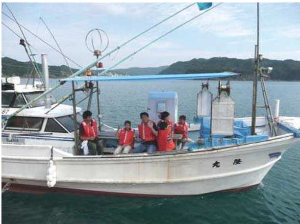
小中学生の漁業体験