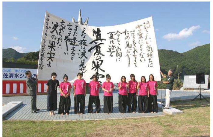
清水高校書道部のパフォーマンス