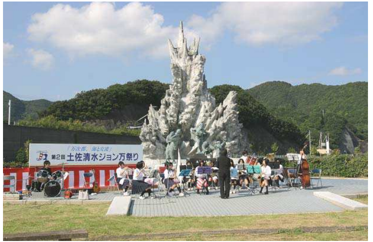
清水高校音楽部の演奏