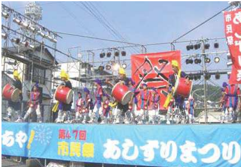
あしずりまつりでエイサー披露