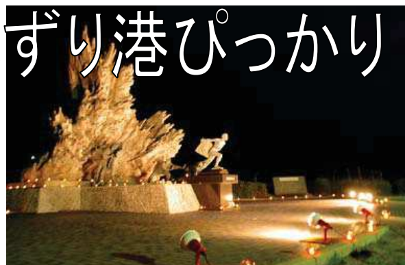
ジョン万群像ライトアップ