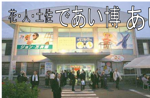
海の駅のライトアップ