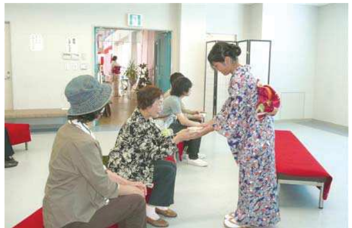
清水高校茶道部によるお茶の接待