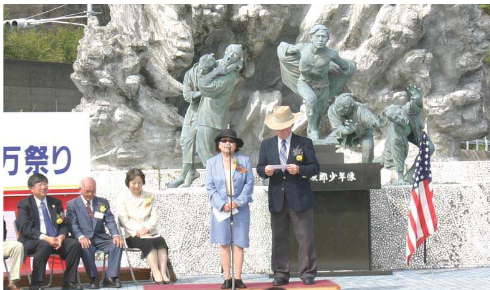
ルーニー会長ご夫妻

また、ハロウィン仮装コンテストやジョン万かるた取り大会、清水高校生による音楽部演奏・書道・お茶の接待・短期留学体験発表のほか、小中学生の漁業体験、近隣市町村の特産品販売、海の駅のライトアップ、あしずり港園地のキャンドルアップ等を行いました。