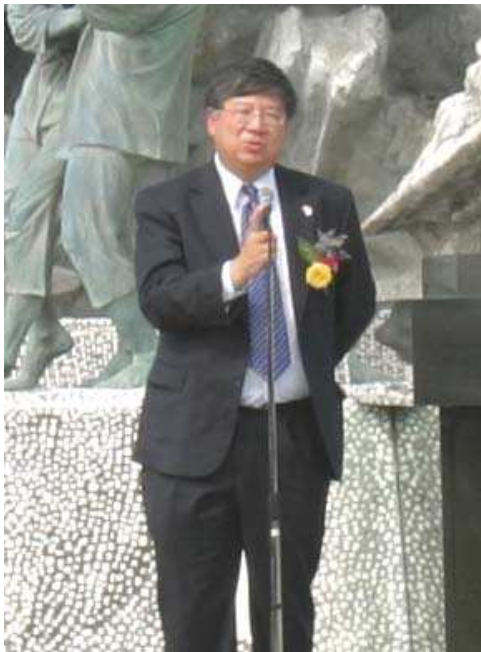
駐大阪・神戸米国総領事エドワード・ドン氏