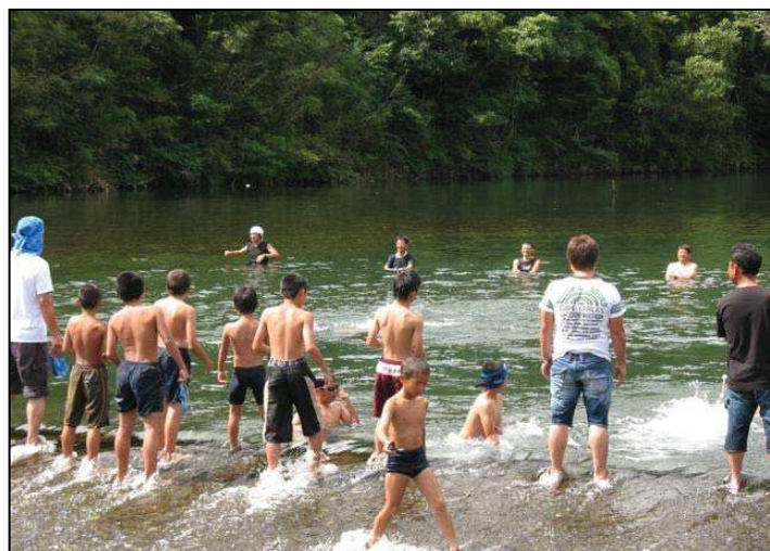
下ノ加江で楽しい川遊び