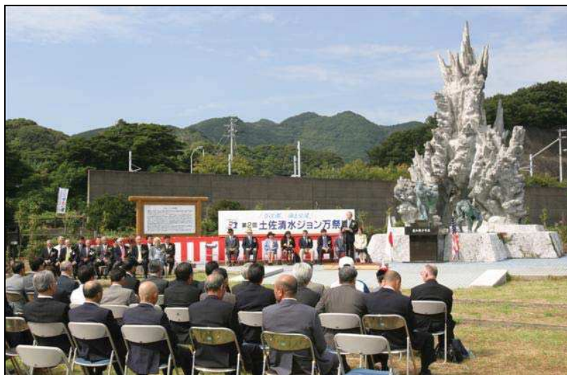
第2回土佐清水ジョン万祭り(H20. 10. 12)

「第3回土佐清水ジョン万祭り」を平成22年10月に開催する予定です。日時や開催場所など詳細につきましては、決まり次第、会員の皆様にお知らせいたします。