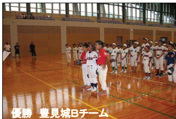
優勝 豊見城Bチーム