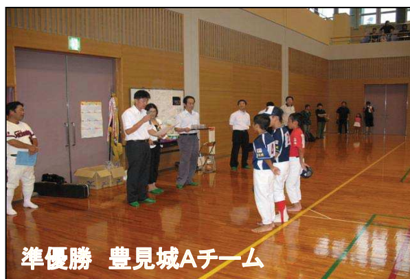
準優勝 豊見城Aチーム