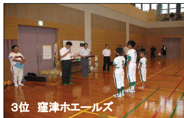
3位 窪津ホエールズ