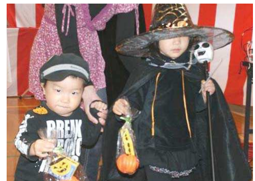
ハロウィンコンテスト