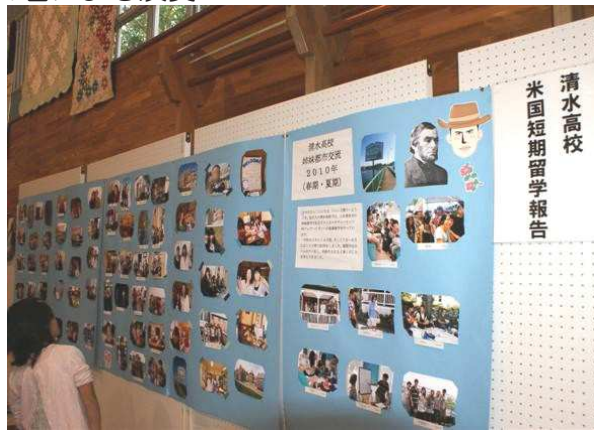
清水高校短期留学報告