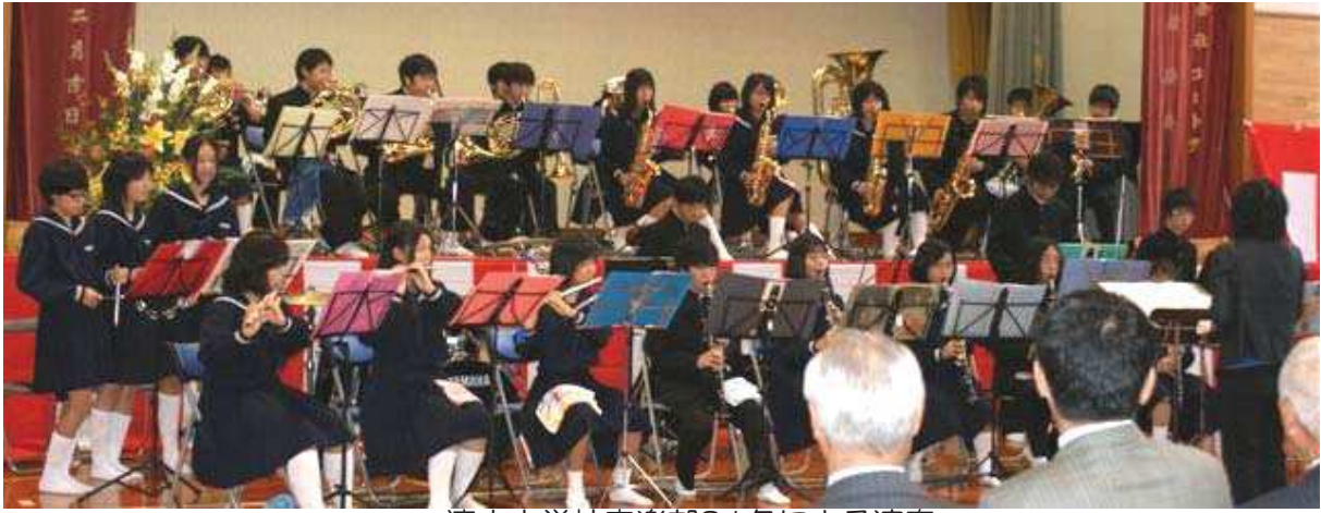
清水中学校音楽部31名による演奏