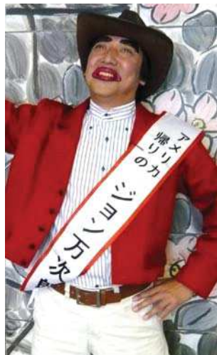
おなじみ清水のジョン万?