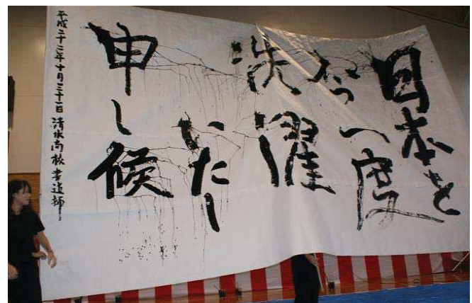
清水高校音楽部「龍馬伝」の音楽にあわせ書道部がパフォーマンス