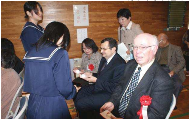
清水高校茶道部の接待を受ける右よりルーニー会長・シルビア議員・文子夫人