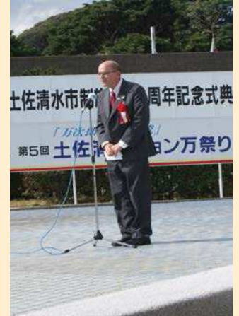
アレン・グリーンバーグ 駐大阪・神戸総領事