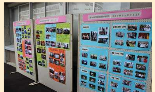
清水高校 短期留学の報告