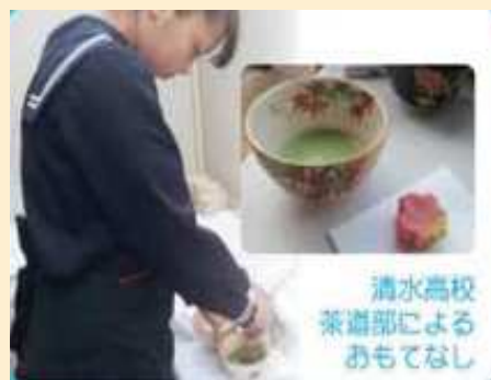
清水高校 茶道部による おもてなし