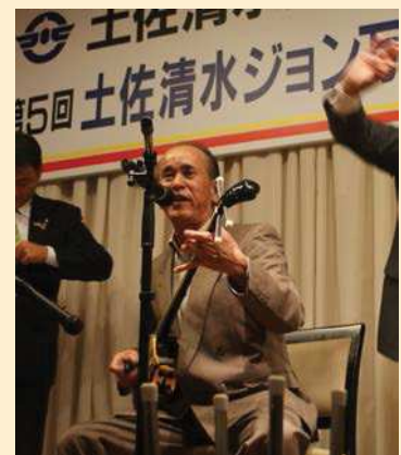
沖縄ジョン万次郎会