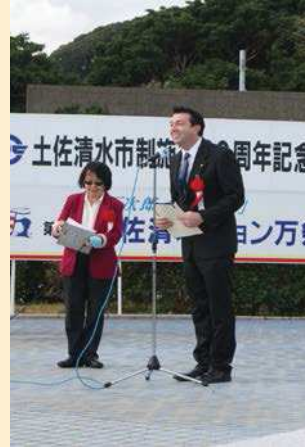
チャールズ・マーフィー 議員セレクトマン