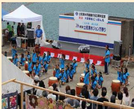
保育園児による太鼓披露