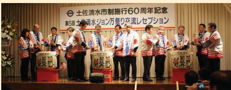
交流レセプション