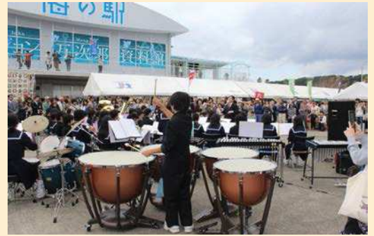
清水中学校 音楽部