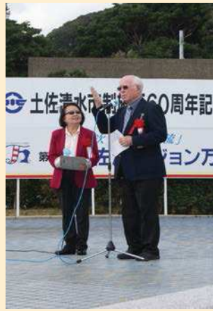
ルーニー会長ご夫妻