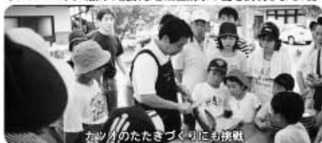
左ツノのたたきづくりに挑戦

「海の生き物と遊ぼう」をテーマに、大阪海遊館主催「海遊館サマースクール」が開催され、関西方面から参加した親子連れなど約50名が7月28日来清し、4日間の日程で磯の生物観察やジンベエザメ給餌の観察など土佐清水の夏を満喫しました。