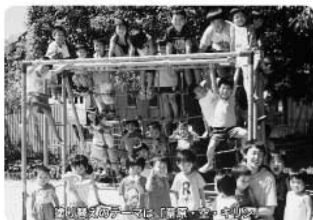
お母さんの手で「清潔・安全」な遊具