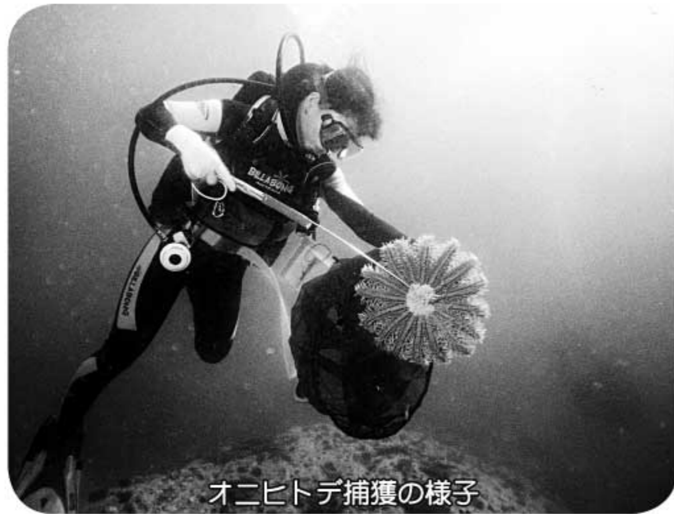
オニヒトデ捕獲の様子

続いて行われた、オニヒトデ駆除は、針金などを加工して作った道具をオニヒトデに引っかけて捕まえる方法で、今回は千尋岬沖でのオニ