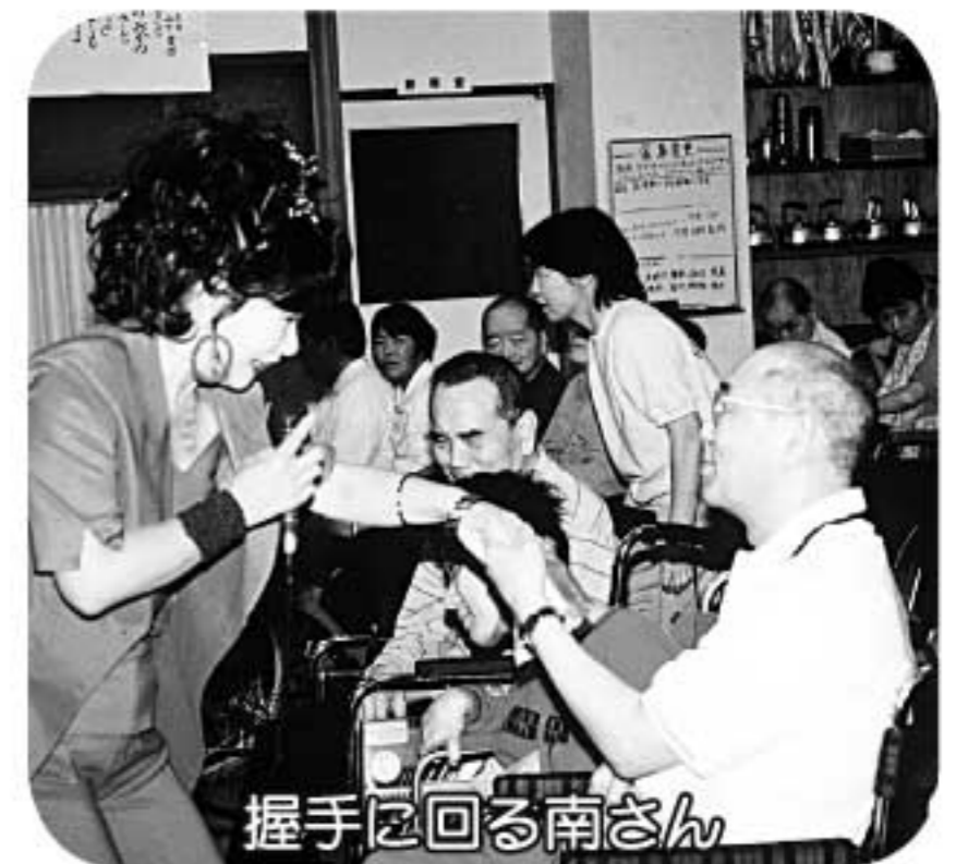
握手に回る南さん