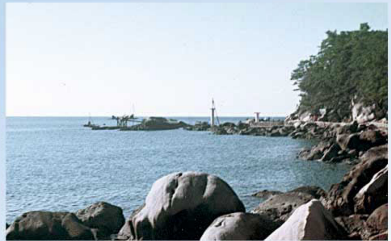
着工前の長島半島