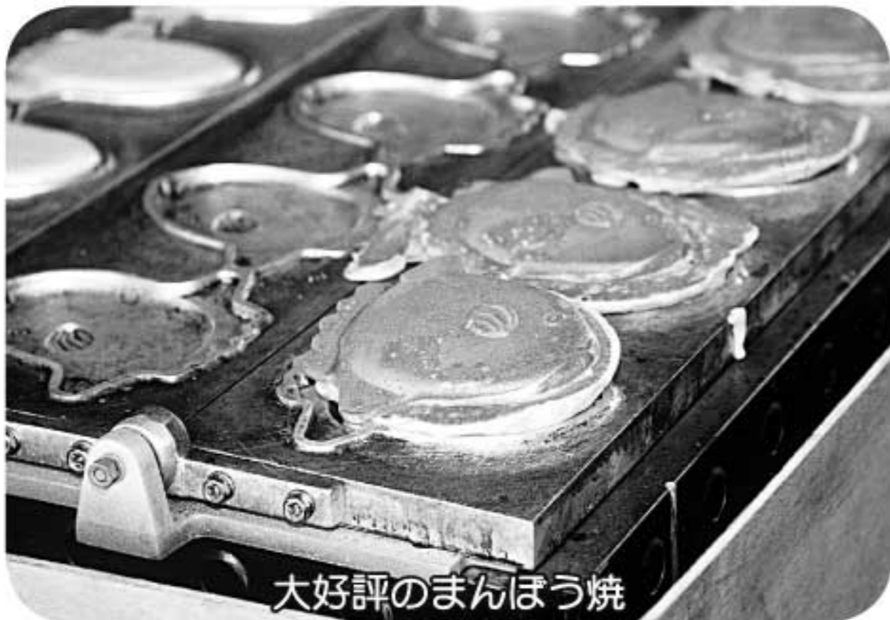
大好評のまんぼう焼