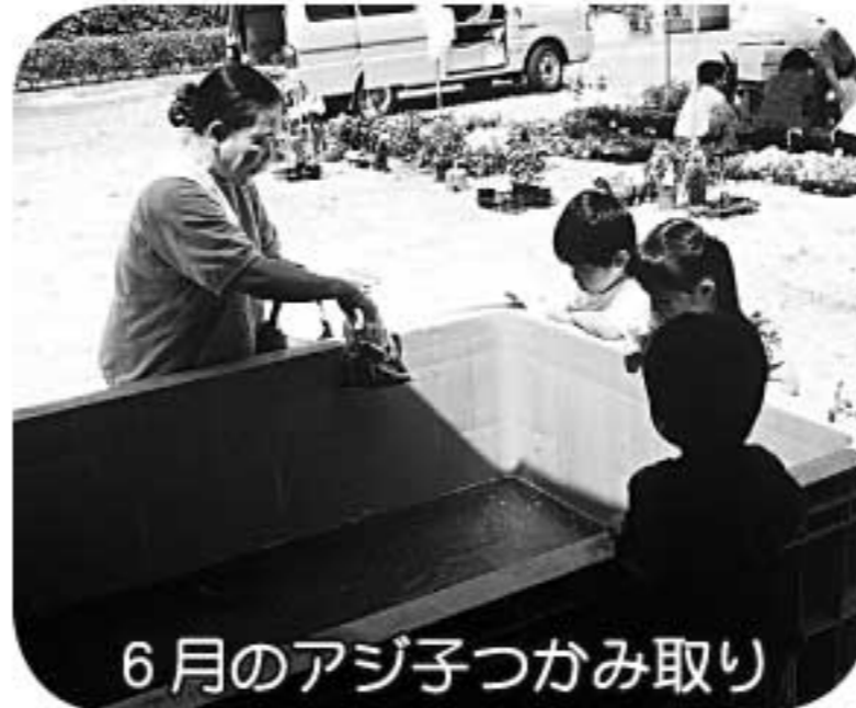
6月のアジ子つかみ取り