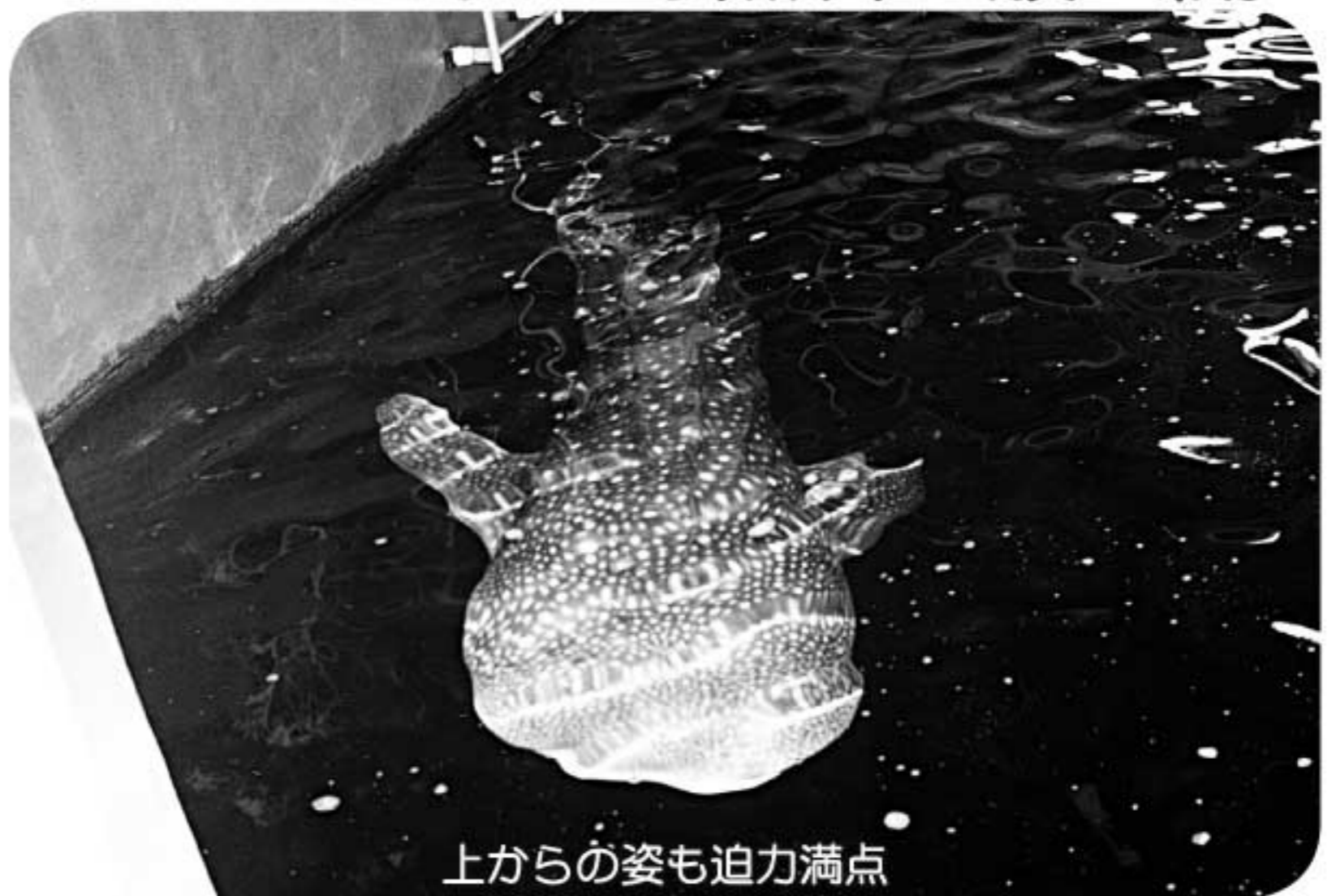
上からの姿も迫力満点