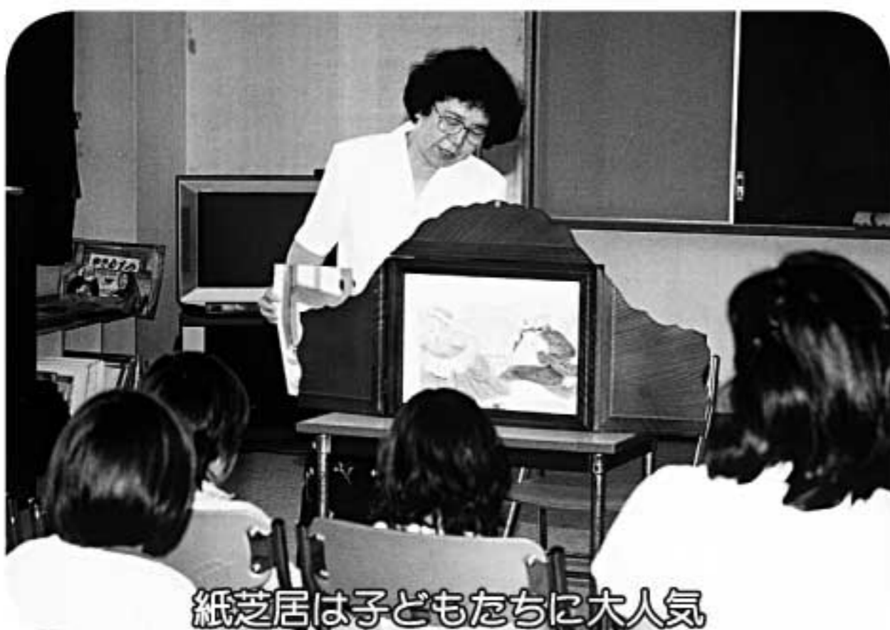
紙芝居は子どもたちに大人気