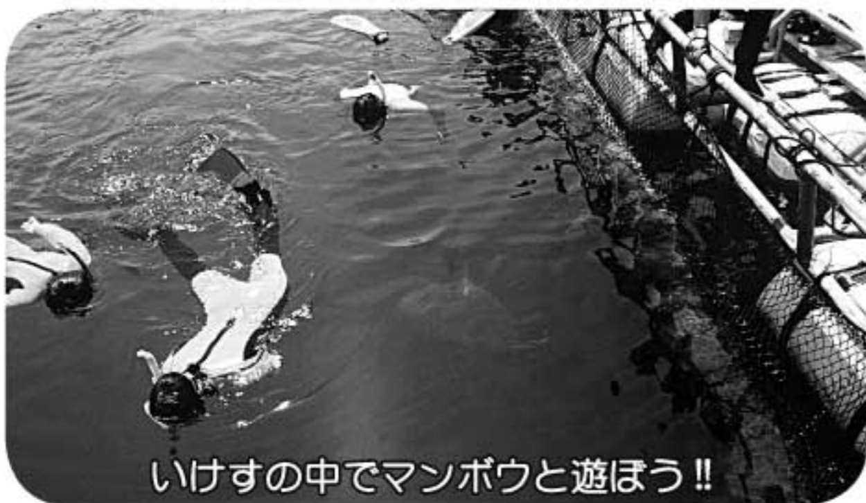
いけすの中でマンボウと遊ぼう!!