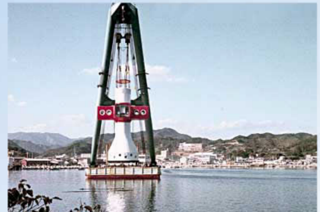
昭和46年11月清水港に到着