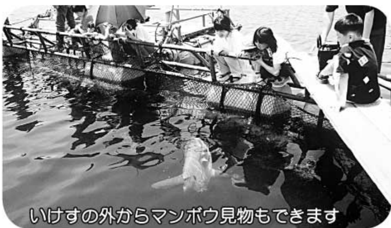
いけすの外からマンボウ見物もできます

同じく第2日曜日に行われる海遊館以布利センターのジンベエザメ無料開放では、飼育されているジンベエザメを水槽の周りで見学できます。大阪海遊館の水槽とはひと味違う迫力が魅力です。