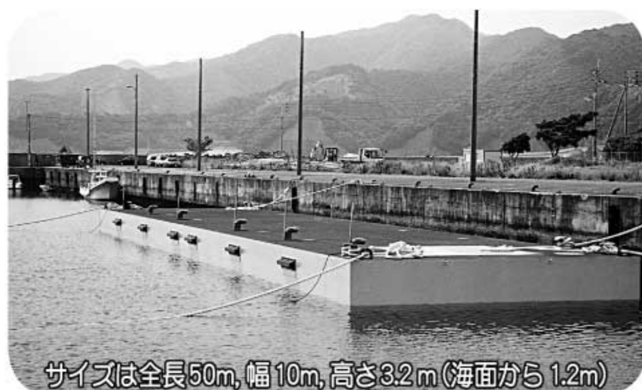
サイズは全長50m、幅10m、高さ3.2m（海面から1.2m）