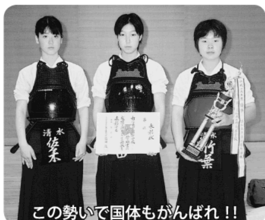
この勢いで国体もがんばれ!!