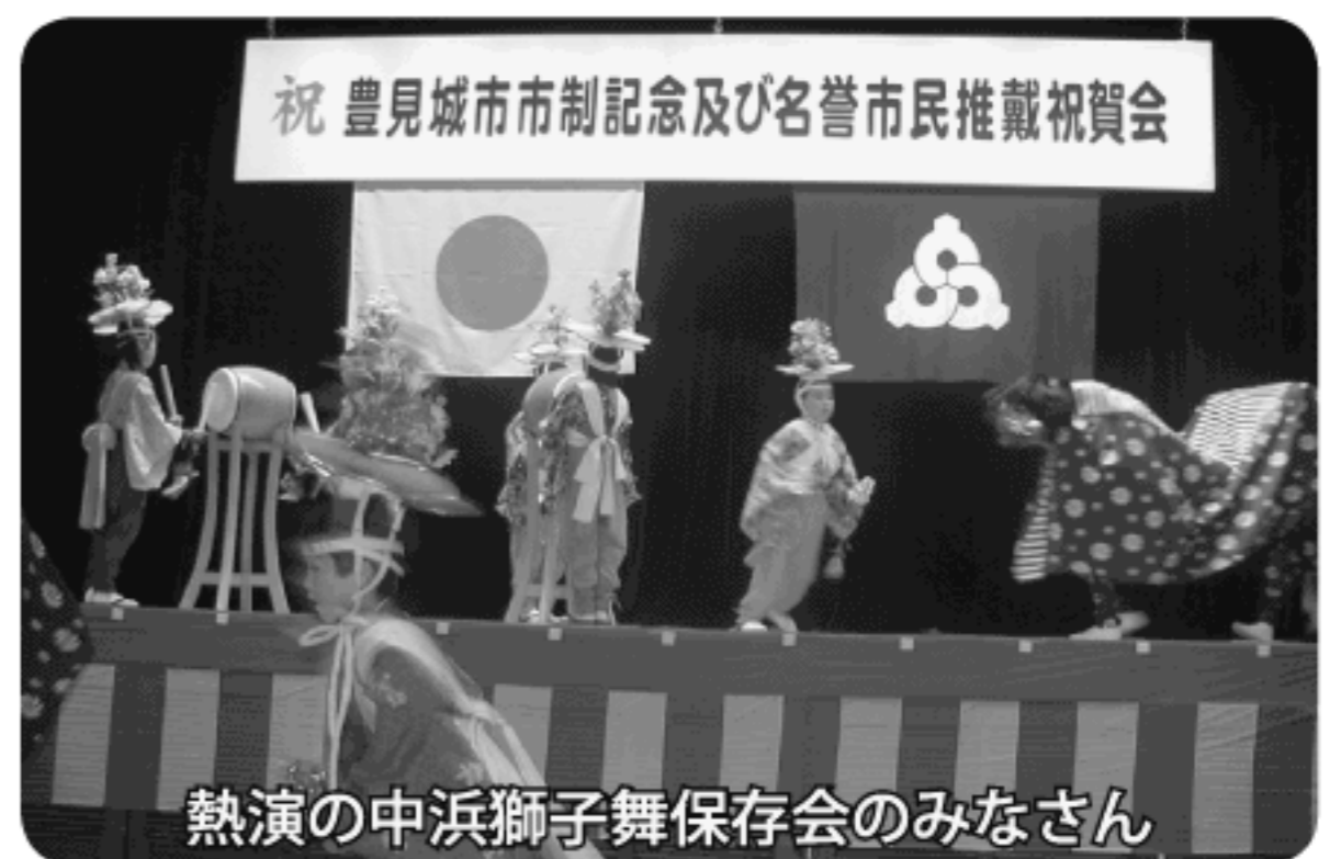
熱演の中浜獅子舞保存会のみなさん

子舞を汗ビツシヨリになって熱演、沖縄では見られない獅子舞に会場は大興奮、祝賀会を大いに盛り上げ、多くの豊見城市民との交流を深めました。