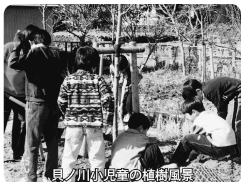
貝ノ川小児童の植樹風景

校や下川口漁港など市内の8カ所に植樹をしました。貝ノ川小学校では、子ども達が植樹を行いみんなで災害からの復興をあらためて誓いました。