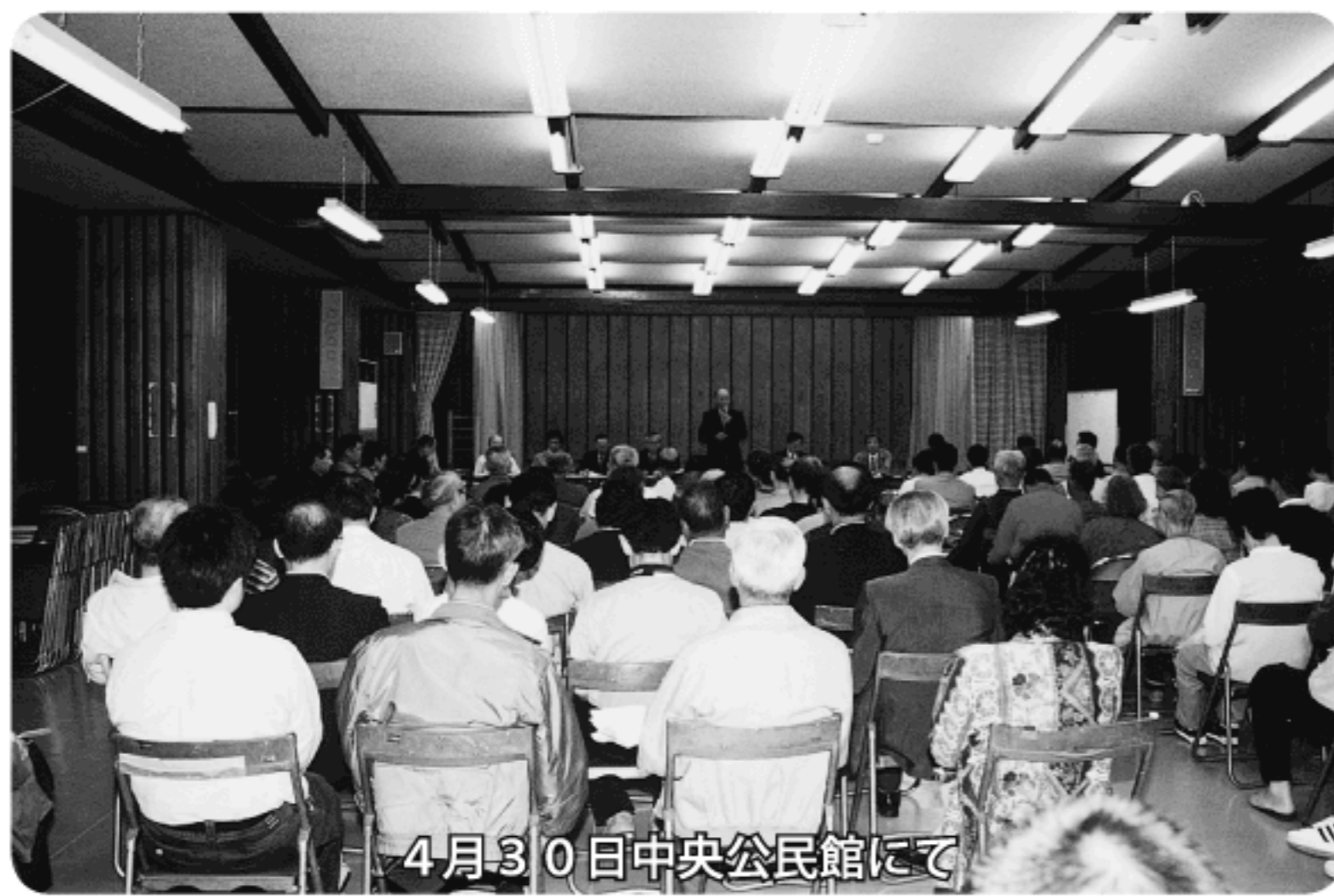
4月30日中央公民館にて

が、本市の加入申し入れについてはこの日は結論に至らず、また否定的な意見もあったということから、厳しいものであるとの認識もしていますが、土佐清水市としては今後も引き続き取り組みを続けてまいります。また単独の場合を想定した研究や資料づくりも行います。今後とも皆様のご理解ご協力をお願いいたします。（記事は5月20日現在）