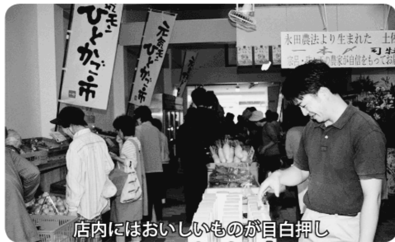
店内にはおいしいものが目白押し

この事業は、商店街のにぎわいを再生しようという中央町振興組合青年部と商工会議所が中心となり、その後市民参加のワーキング委員会により、「現在の中心商店街に何が足りないか必要なのか」を考えながら進めてきたもので、無料休憩所