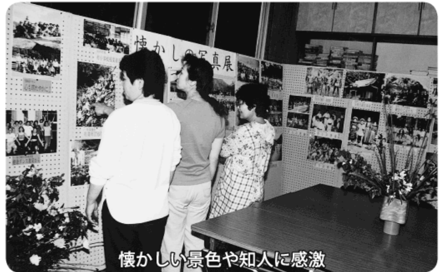
懐かしい景色や知人に感激

明治・大正・昭和・平成の学校、職場や風景など、地域の様子を記録した写真展が、4月23日から5月20日まで下ノ加江地区公民館で開かれました。展示された写真は70点で、鑑賞した市民のみなさんは、写された風景や知人の姿に懐かしさのあまり感涙する人も見られるなど、大好評となりました。なお、この写真展は今後、市の行事に併せて随時地域に出向き開催する予定ですので、ご鑑賞下さい。また、写真はご希望があれば地域や学校の行事にも貸し出しもしますのでご利用下さい。