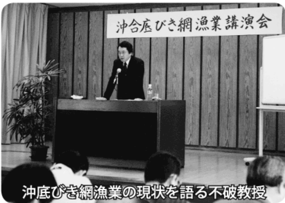
沖合底びき網漁業の現状を語る不破教授