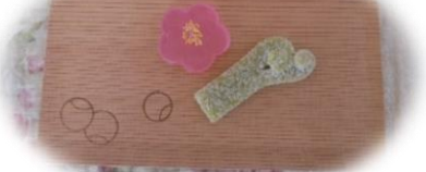
梅の花（干琥珀） 萩（州浜）