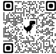
どんぐりっこホームページQRコード

新型コロナウイルス感染症拡大防止について 参加前に親子で検温していただき、平熱の場合参加可能。保護者さんのマスク着用。 手洗い・アルコール消毒をお願いしています。 また、風邪症状がある場合は活動参加を控えていただく場合があります。 ※どんぐりっこの予定が変更の場合がありますのでご了承ください。ホームページ等でご確認ください。