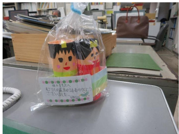
↑ 授業の様子(右上・左上下)、プレゼントしていただいた紙のひな人形(右下)

2月28日(火)5～6校時の2時間扱いで、標記の出前授業を市史編さん室田村と吉本が足摺岬小へお伺いして実施した。5時間目は、中浜小「歴史資料保存スペース」から小型の民具を持参し、児童に直に触ってもらいながら授業を展開した。大型の民具は、電子黒板に写して見てもらった。