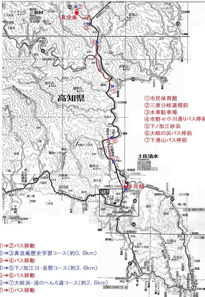
遍路道ウォークコース図